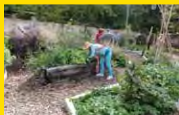
Inauguration des Jardins municipaux