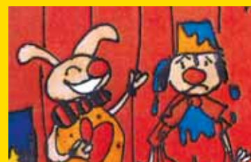
Une jeune briissoise primée au Festival d'Angoulême