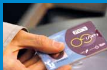
Votre forfait Navigo devient "toutes zones"