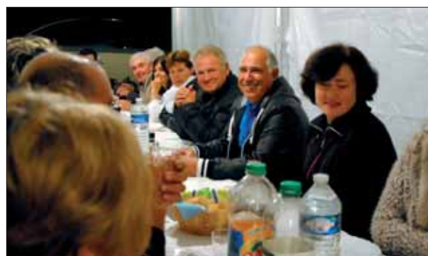
Fête de quartier 2015 du chemin des Vignes

C'est aussi l'occasion pour d'anciens habitants et précédentes générations de ces quartiers briissois de revenir aux sources et de faire la connaissance