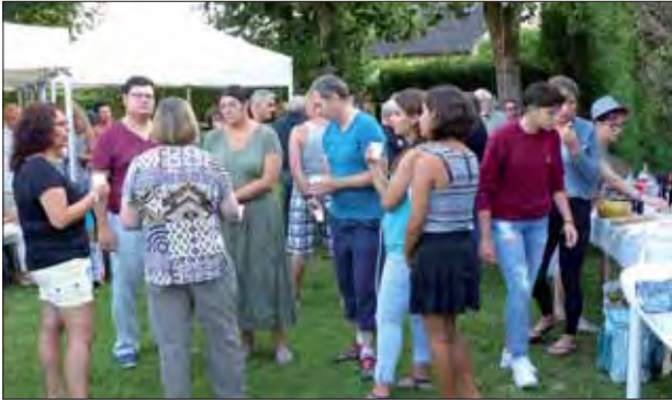
Fête de quartier 2015 des Couvaloux

avec leurs successeurs : ces anciens habitants sont les vecteurs de la mémoire et relatent anecdotes et histoires de ces endroits. Ceci pour le plus grand plaisir des conteurs et de ceux qui découvrent le passé de l'endroit où ils vivent.