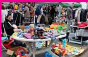
La Brocante : le grand rendez-vous de l'automne