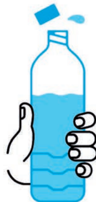
JE BOIS RÉGULIÈREMENT DE L'EAU

En période de canicule, quels sont les bons gestes?