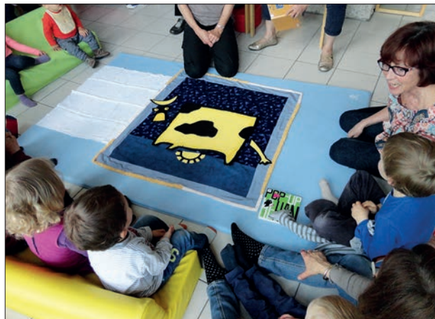
Plusieurs animations en direction des tout-petits ont eu lieu au cours de cette semaine. Accompagnés de leurs parents ou de leur assistante maternelle, ils ont notamment pu découvrir le raconte-tapis "Jojo la mache".