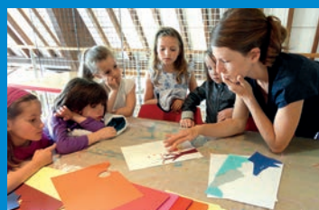
La Médiathèque 10 ans que ça dure