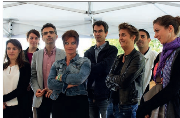
Les professionnels de santé du village, partenaires du projet.