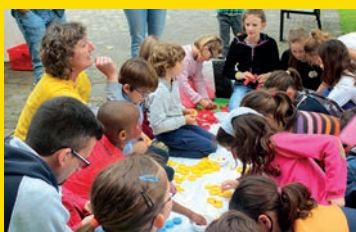
Festival Jeux Thèmes Une 5 e édition réussie