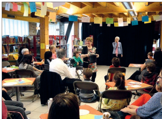
Salle pleine pour le spectacle sur mesure "10 ans, ça conte !", par les conteuses de la Médiathèque. Après avoir régalié nos yeux et nos oreilles d'histoires autour du livre et de l'imaginaire, ainsi que de devinettes et de tours de magie, l'après-midi s'est conclu sur un goûter partagé.

Parmi nos témoignages préférés : "Je n'ai jamais autant lu depuis 10 ans."; "Dix ans déjà ! Du bonheur, du bonheur..."; "Calme, sérénité et rires d'enfants"; "Mon moment préféré à la médiathèque, c'est quand ma mère me laisse tranquille."