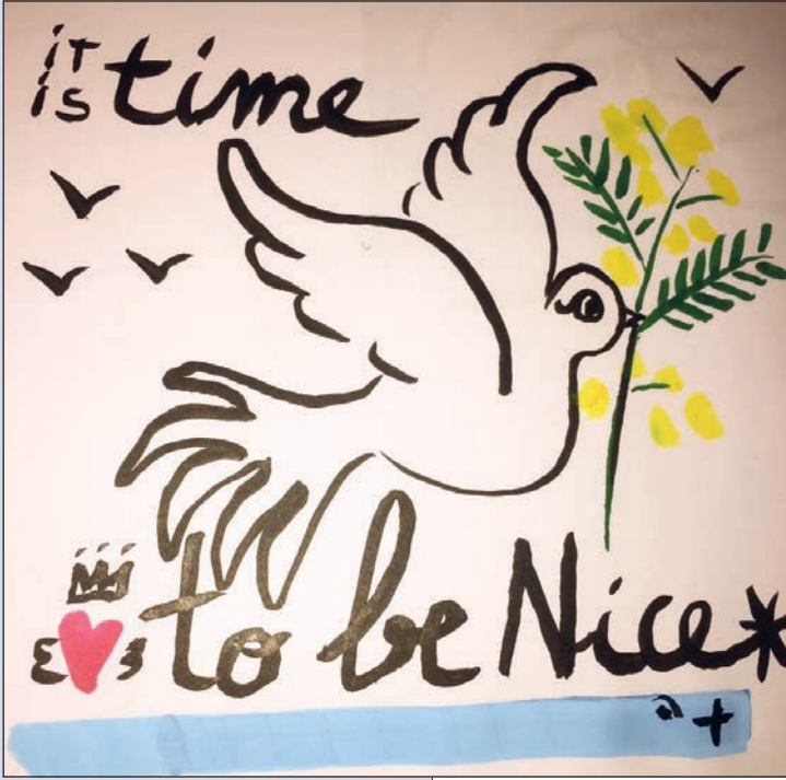
Hommage du créateur Castelbajac aux victimes de Nice.

À Nice, le sang des innocents a de nouveau coulé et en premier lieu, celui des enfants. Les mots ne suffisent pas à consoler, à réparer, à apaiser. L'indignation et la révolte des Français répondent à la souffrance des victimes.