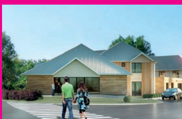
Maison de Santé Pose de la 1 re pierre