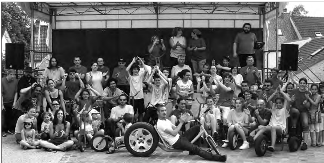
Une partie des bénévoles, ces Briissois sans qui rien ne serait possible.

La journée du samedi s'est terminée, après un excellent repas portugais et par une soirée casino organisée en partenariat avec l'association Morphée. Les Briissois qui le désiraient pouvaient faire un petit voyage dans le temps pour jouer à la roulette, au black jack et autre craps pendant la période de la prohibition et être mêlé à une intrigue qui prenait corps dans la soirée. Point